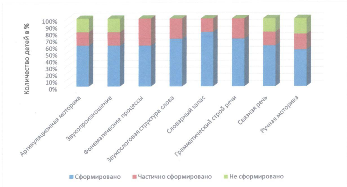
Таблица мониторинга речевого развития детей подготовительной группы компенсирующей направленности в 2020 – 2021 учебном году (итоговый мониторинг)